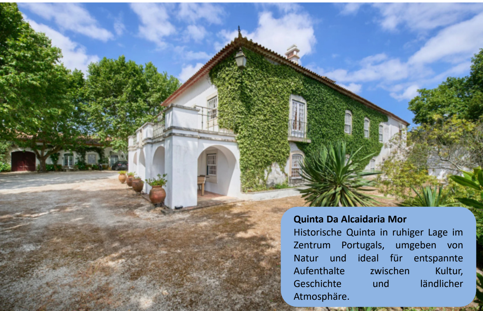
Quinta Da Alcaidaria Mor Historische Quinta in ruhiger Lage im Zentrum Portugals, umgeben von Natur und ideal für entspannte Aufenthalte zwischen Kultur, Geschichte und ländlicher Atmosphäre.