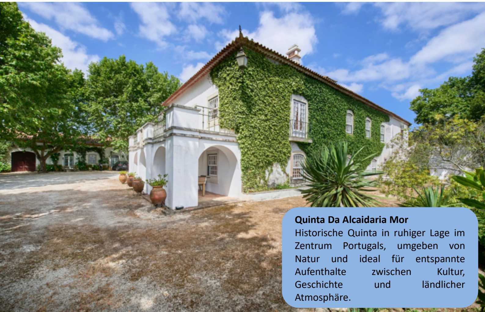
Quinta Da Alcaidaria Mor Historische Quinta in ruhiger Lage im Zentrum Portugals, umgeben von Natur und ideal für entspannte Aufenthalte zwischen Kultur, Geschichte und ländlicher Atmosphäre.