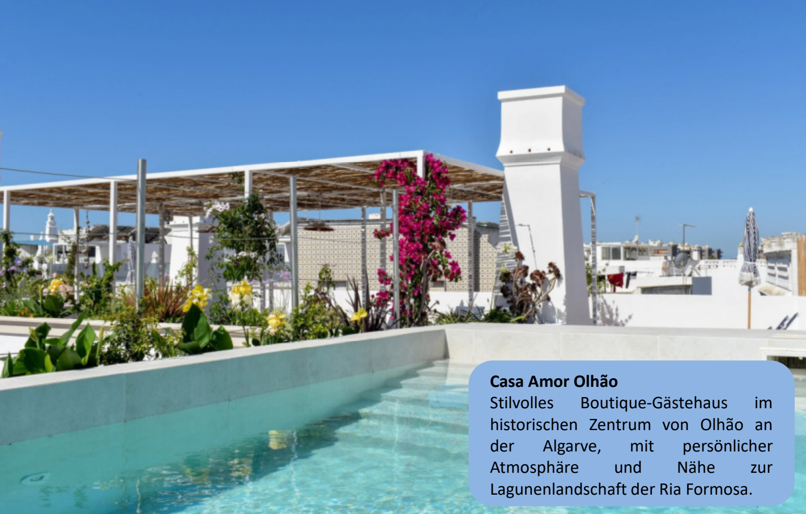
Casa Amor Olhão Stilvolles Boutique-Gästehaus im historischen Zentrum von Olhão an der Algarve, mit persönlicher Atmosphäre und Nähe zur Lagunenlandschaft der Ria Formosa.