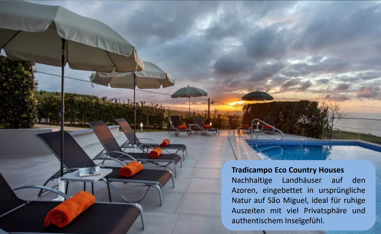
Tradicampo Eco Country Houses Nachhaltige Landhäuser auf den Azoren, eingebettet in ursprüngliche Natur auf São Miguel, ideal für ruhige Auszeiten mit viel Privatsphäre und authentischem Inselgefühl.