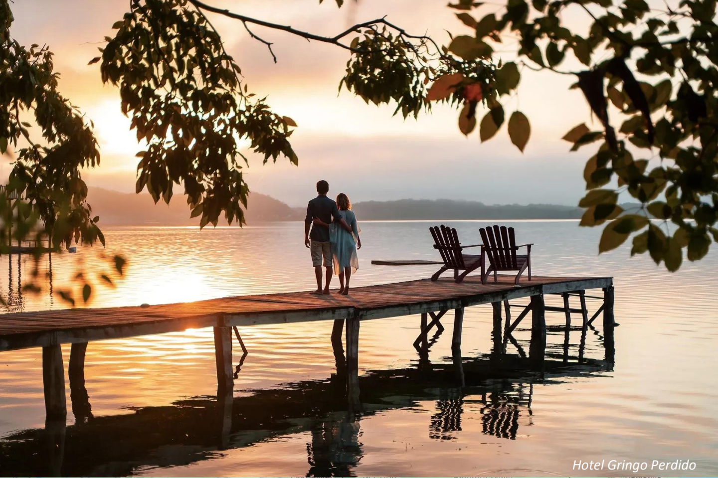
Hotel Gringo Perdido